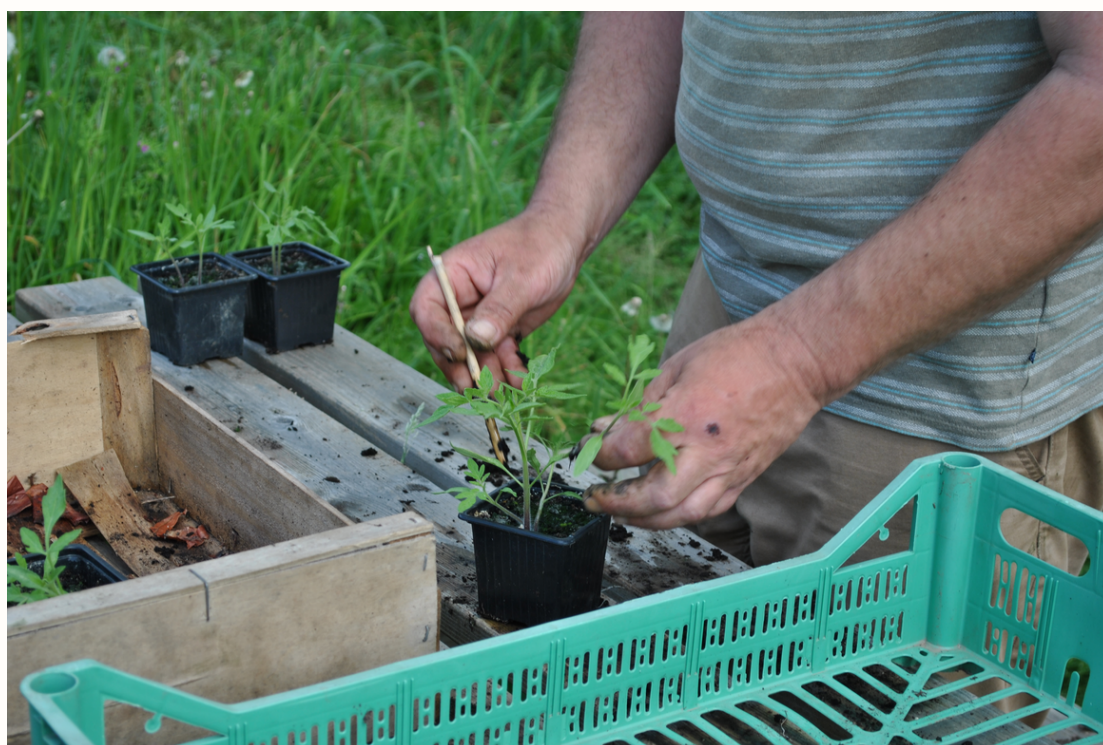
Figure 1 : Séparation des plants de tomate. Le traitement singularisé de chacun des plants produit en retour une singularisation des relations, depuis les végétaux aux être humains.

Les techniques simples laissent davantage de place aux diversités et à l'expressivité à la fois des humains et des autres vivants. Faire des semis en godets implique par exemple de passer chaque pot en revue un à un, laissant davantage d'espace aux spécificités, aux typicités, de chaque individu plante. Les plantes font l'objet d'un traitement singularisé : « Elles ne sont pas anonymes mes plantes. » expliquera un jour Cédric, qui par-là insiste sur l'attention que produisent les méthodes de travail, entièrement manuelles, qu'il a choisies. Elles ne sont pas anonymes parce que travailler manuellement implique de toutes les manipuler, parce que les déambulations quotidiennes dans la pépinière conduisent à fabriquer au jour le jour une intimité avec ces végétaux, aussi parce que le refus de chauffer la serre et ce travail singulier conduit à une hétérogénéité des plants selon l'emplacement dans la serre ou la position sur les tables, etc.