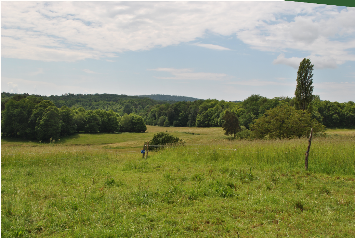
Figure 8 : Des haies et des clôtures transparentes. Jean-Baptiste a développé un intérêt croissant pour les paysages, qui s'exprime en particulier à travers la replantation de haies, et son affection pour la pose de clôtures « transparentes », qui laissent des paysages « ouverts » et « sans frontières ».