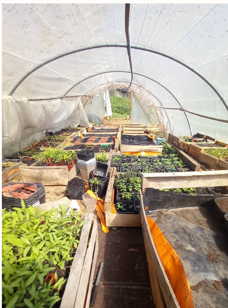
Figure 7 : La serre d'Estelle, un espace plein d'ajustements. La serre est trop basse et le développement d'une activité de production de plants pose la question de l'espace disponible.

A un second niveau, le travail sur l'ergonomie des systèmes s'observe dans la mise en place d'aménagements et de dispositifs visant à rendre le travail plus confortable. L'espace de la ferme fait ainsi l'objet d'ajustements pour fluidifier les mouvements et déplacements des paysan.nes. Estelle explique par exemple les difficultés qu'elle rencontre au fur et à mesure du développement de son activité. Sa serre actuelle, dont la structure commence à être à la fois trop abîmée et de trop petite taille, lui impose de se pencher légèrement lorsqu'elle travaille, mais lui pose aussi une problématique de stockage de ses plants au fur et à mesure du développement de son activité de production. Les multiples petits ajustements qu'elle fait quotidiennement, mis bout à bout, représentent une lourde charge physique et mentale : les caisses qu'il faut sans arrêt déplacer, porter d'un bout à l'autre de la serre, les multiples arrosoirs et petits aménagements à mettre en place absorbent de l'énergie et la contraignent parfois à rompre son rythme de travail. Ces installations non-optimales sont également vectrices d'inquiétude : y-aura-t-il assez de place ? N'y-a-t-il pas un risque d'abîmer les plants ? Que faut-il anticiper ? Etc. Ici, la fluidification des déplacements – en permettant d'oublier la structure – lui permettrait de gagner en confort à la fois physique et mental en facilitant une routinisation de l'organisation du travail et des gestes techniques.