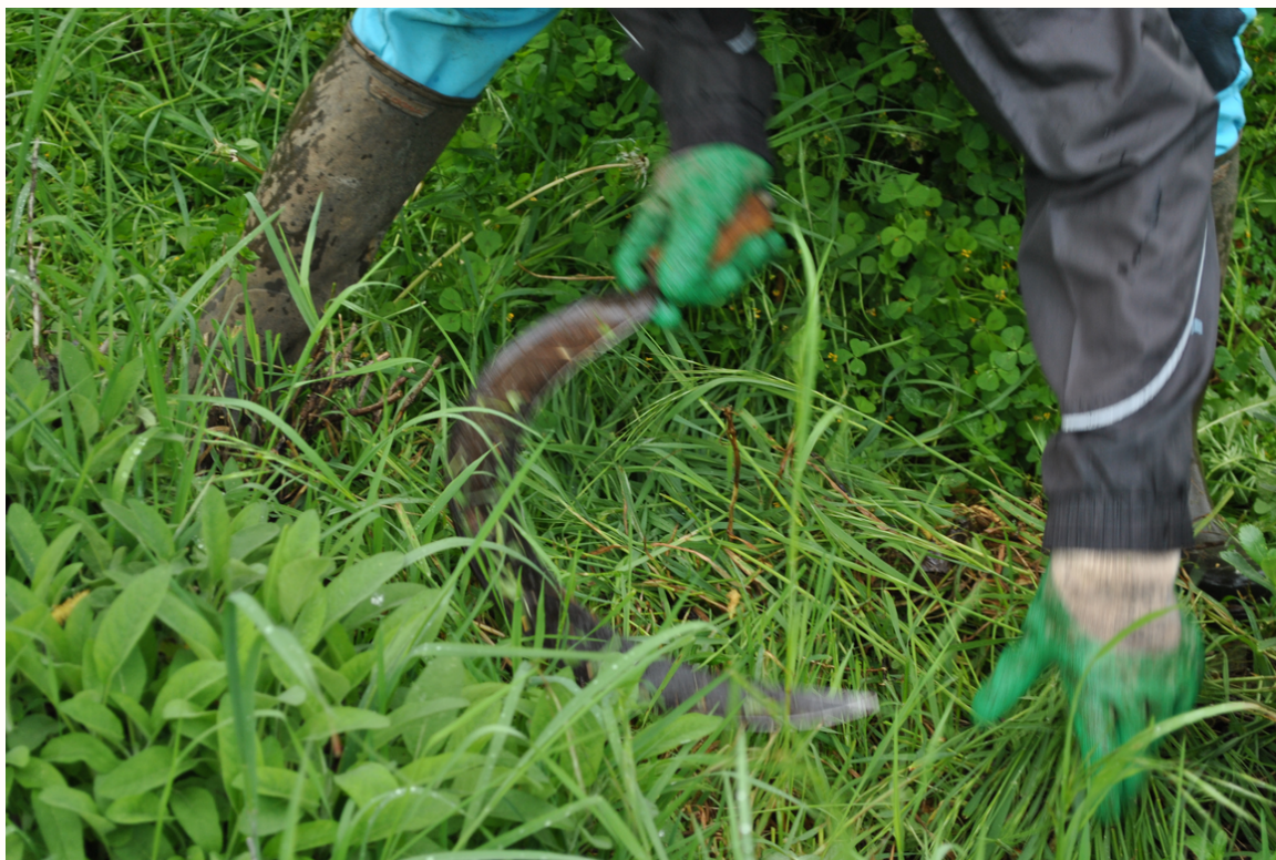
Figure 2 : Des gestes qui brouillent les limites.